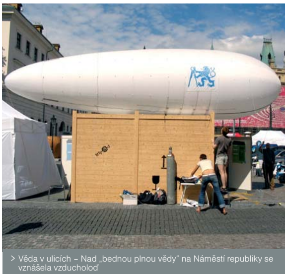
> Věda v ulicích – Nad „bednou plnou vědy“ na Náměstí republiky se vznášela vzducholod'

Ve dnech 22.–23. 6. probíhala v pražských exteriérech výstava Věda v ulicích. Projekt Tripod zde pomáhal formou nápaditých expozic a plakátů zviditelnovat výsledky výzkumu na Fakultě elektrotechnické a Fakultě biomedicínského inženýrství ČVUT. Na Náměstí republiky a náměstí Jiřího z Poděbrad vyrostly „bedny plné vědy“ – stánky do detailu připomínající typické dřevěné přepravní bedny včetně symbolů „neklopit“ a „křehké“.