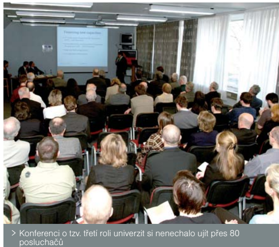
> Konferenci o tzv. třetí roli univerzit si nenechalo ujít přes 80 posluchačů

ního vlastnictví na univerzitách. Charles Wessner a profesor Haňka hovořili zejména o nutnosti systémových změn, které by měly nastavit podmínky pro hladký průběh transferu technologií. Z konference byl pořízen videozáznam, který je ke shlédnutí po zaregistrování na stránkách www.3pod.cz .