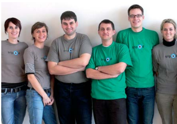
> Tým projektu Tripod

Netrpíme nostalgii a s optimismem hledíme do budoucnosti. Přesto se sluší zopakovat některé zásadní momenty z dvouleté historie projektu Tripod při ČVUT v Praze, který dne 29. srpna ukončuje svou činnost.